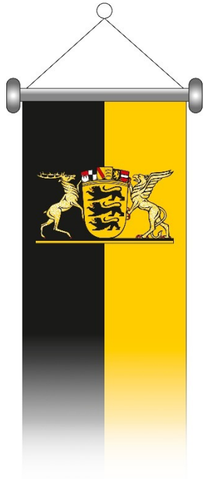
Muster II.5 (Banner):