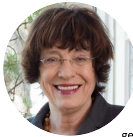
Manne Lucha , Minister für Soziales und Integration

Viele Menschen in Baden-Württem- berg bringen sich ein, um ihr Lebensumfeld zu gestalten. Dabei